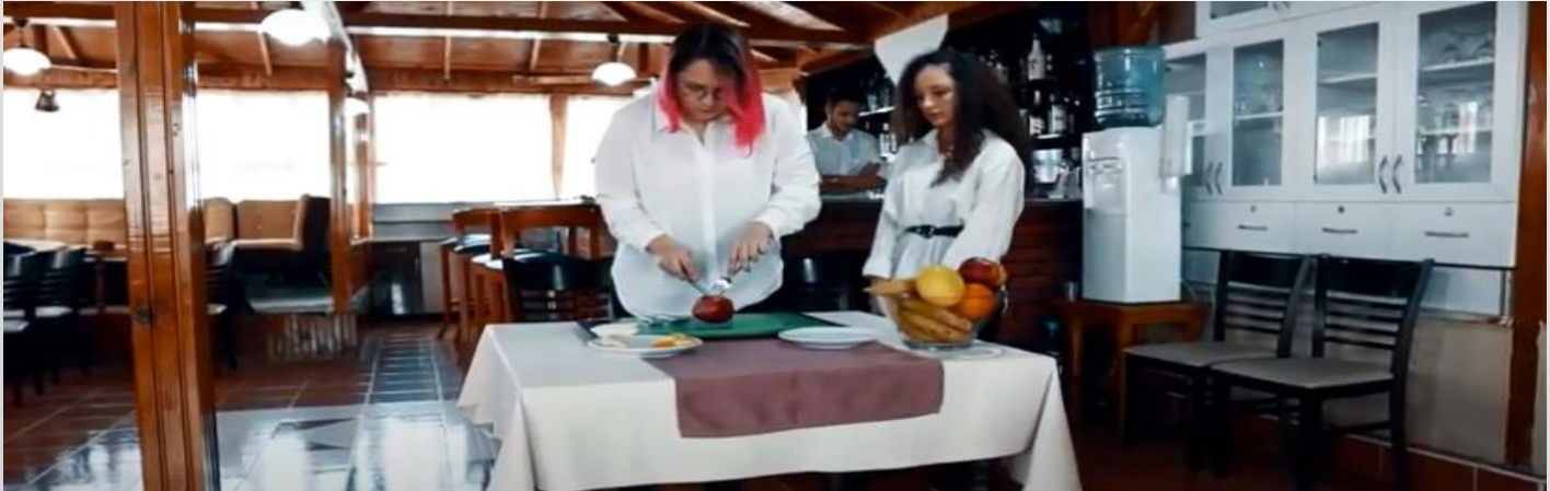
(Servis Uygulama Atölyesi)