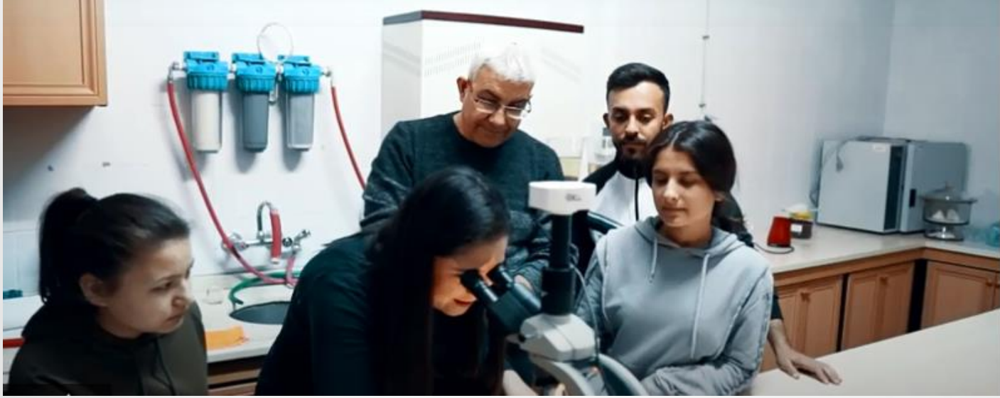
(Bitkisel Analiz Laboratuvarı)