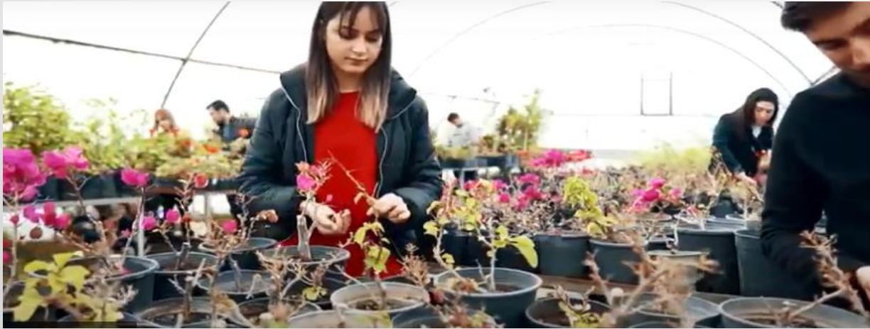
Peyzaj ve Süs Bitkileri Yetiştiriciliği Programı Bitki Üretim Seraları