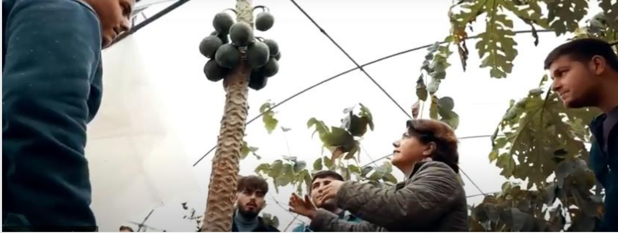
Bahçe Tarımı Programı Uygulama Seraları